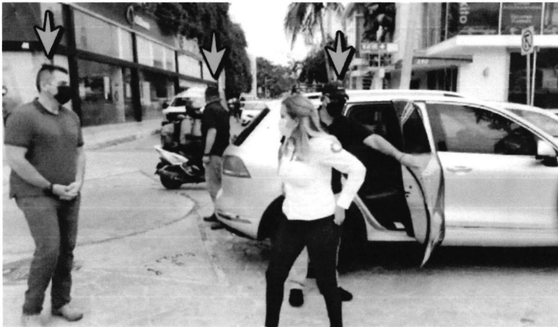
https://www.facebook.com/NoticiasPDC/photos/pcb.1972285249586074/1972284656252800 ... (sic).